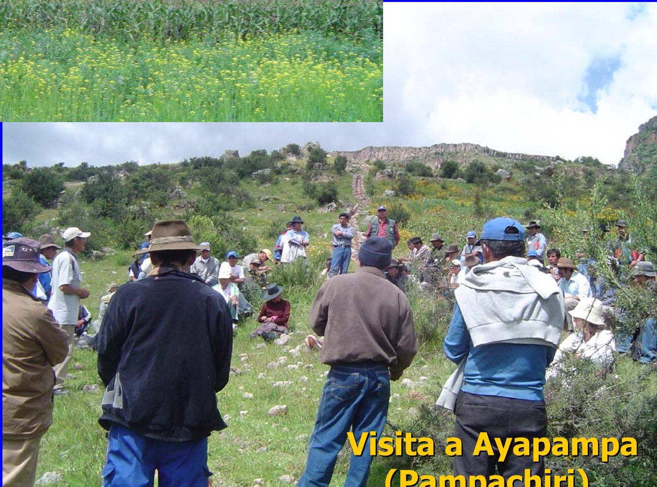
Visita a Ayapampa (Pampachiri)